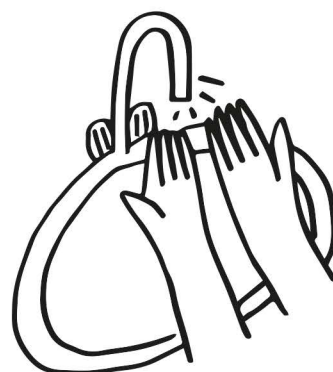
opláchneme ruky vodou