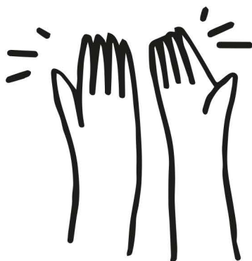
ručičky sú čisté a voňavé