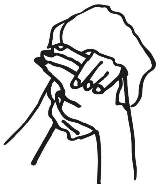
osušíme ruky, najlepšie papierovou utierkou