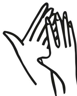
trieme dľaň o dľaň