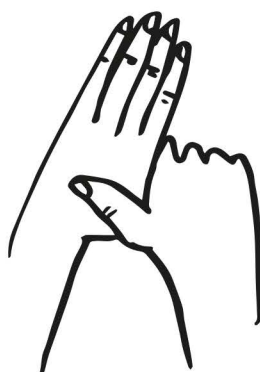
krúživým pohybom obopneme palec na ruke