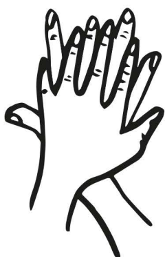
vnútorné strany prstov v polohe dľaň ku dlani